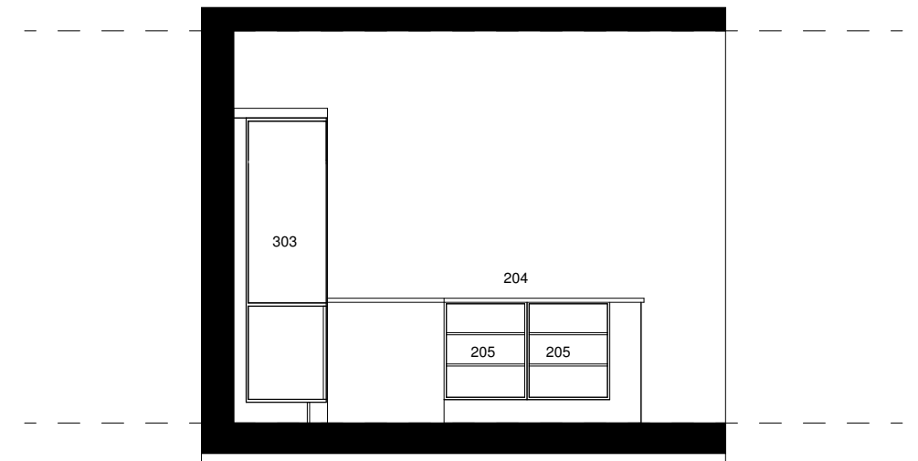
Fremtidig opstalt i kantine 2