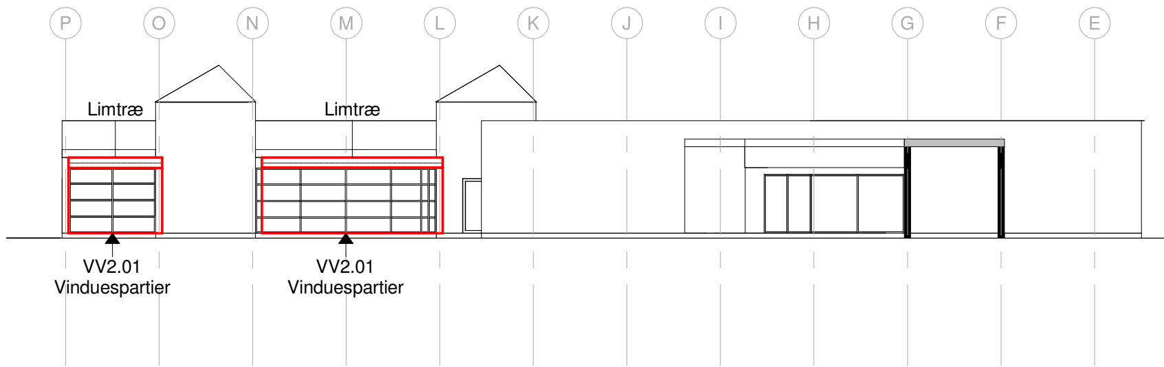
Facade blok 4 - Øst Eks. forhold