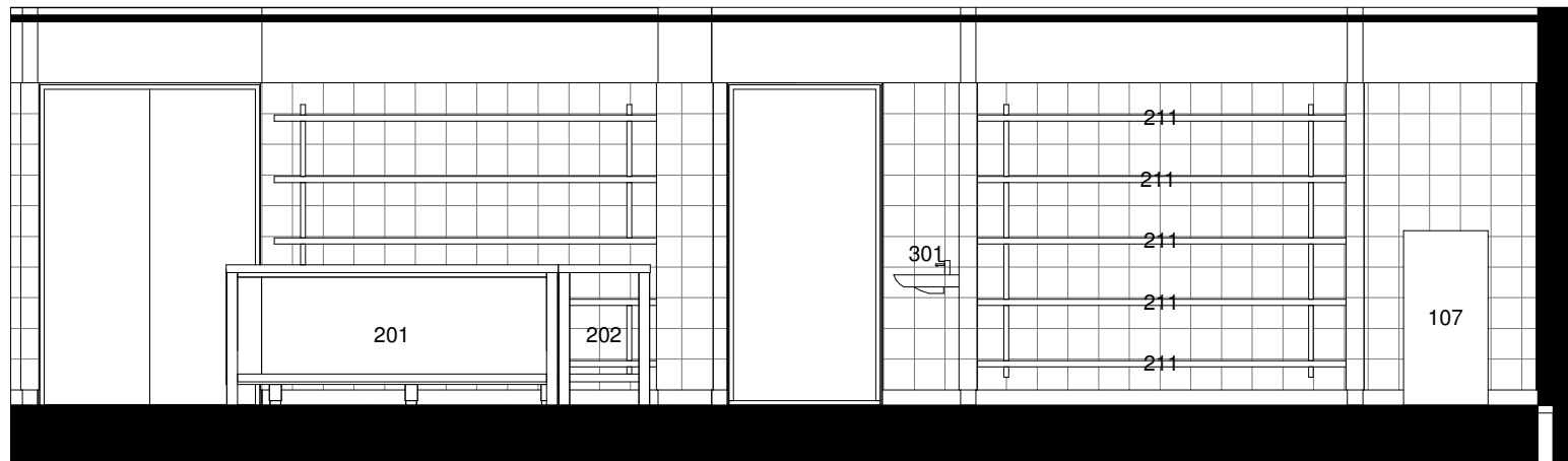
Opstalt C 1 : 50