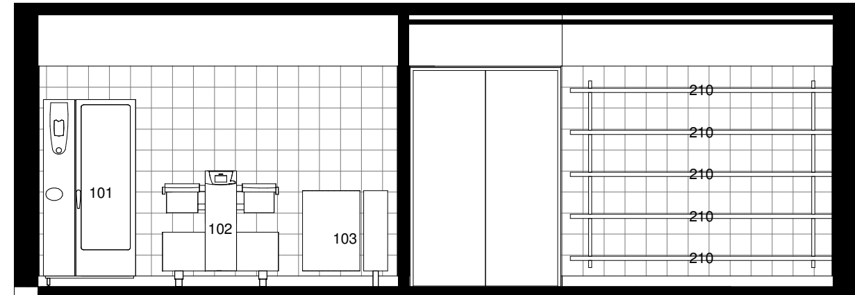
Opstalt A 1 : 50