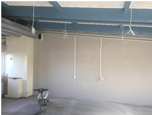
Bygning 10, 1. sal (lokale 102)

TMC ønsker afklaring på inddækning mod loft. Samt udførelse af forsatsvæg.