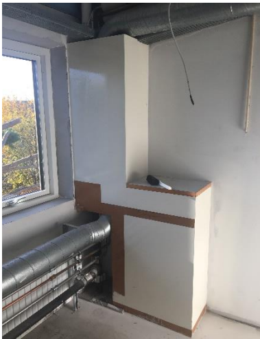
Bygning 10, 1. sal (lokale 110, depot)

Eksist. Inddækningskasse malerbehandles.