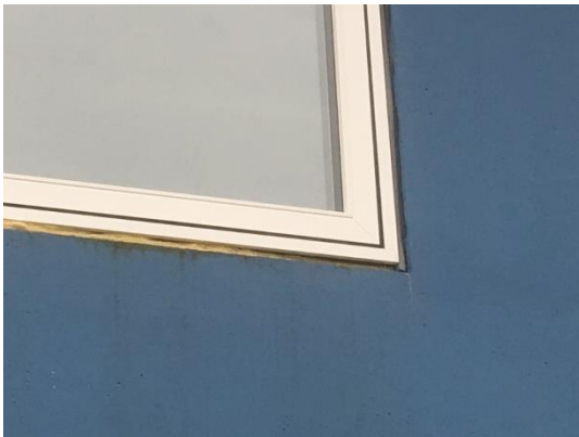
Blok 10 – 1. sal

Overføres fra sidste tilsyn - Fugning udvendig (og får den sags skyld også indvendigt) mangler