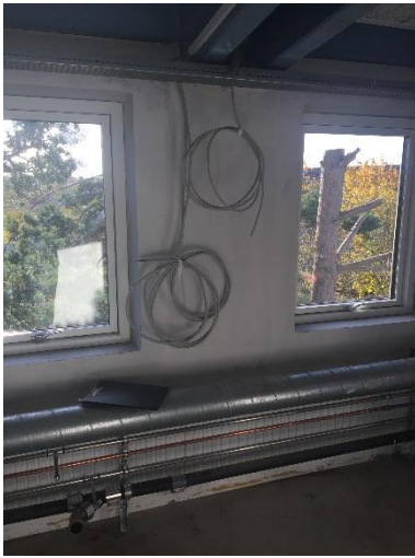
Bygning 10, 1. sal (lokale 110, depot)

Let skillevæg udføres med lodret og vandret udskæring omkring installationer. Hul omkring installationer bliver skjult af inventar mod lokale 108. Der lukkes bedst muligt fra depotside. Målsætning af væg af aftalt til min 1800. så der er plads til inventar. Inventar udføre bordplade over installationer.