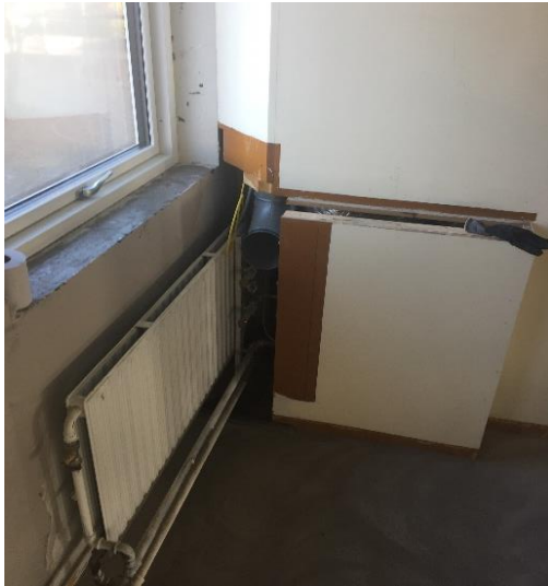
Bygning 10, 1. sal (lokale 102)

TMC ønsker afklaring på hvorledes lukning ved rørkasse skal udføres.